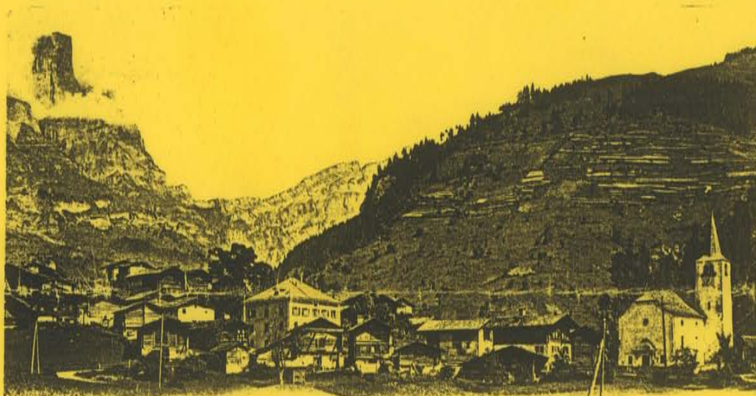
J. J. 2000 Inden (Valais)